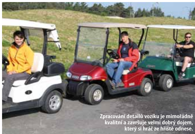
Zpracování detailů vozíku je mimořádně kvalitní a završuje velmi dobrý dojem, který si hráč ze hřiště odnese.

„RXV změnilo hru v golfovém průmyslu. Tohle posunulo golfový vozík na zcela novou úroveň,” říká golfová legenda ARNOLD PALMER, který je autorem více než 300 hřišť a jehož společnost provozuje mnoho vynikajících areálů. „E-Z-GO navázalo na svou tradici inovace, vytváření podmínek pro ještě příjemnější prožitky ze hry pro každého, kdo hraje. Jsem hrdý na můj dlouhodobý vztah s EZGO. Těším se to že s E-Z-GO budu nadále úspěšně spolupracovat.“