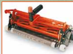
Plně plovoucí žací jednotky s možností natáčení