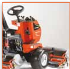
Ergonomicky uspořádané pracoviště operátora přístupné z levé i pravé strany

Příslušenství obsahuje vertikutační jednotky, spikery, kartáče, válce a patentovaný Turf Groomer.