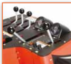
Nezávislé ovládání každého vřetene dovoluje použití vřeten samostatně nebo v kombinaci